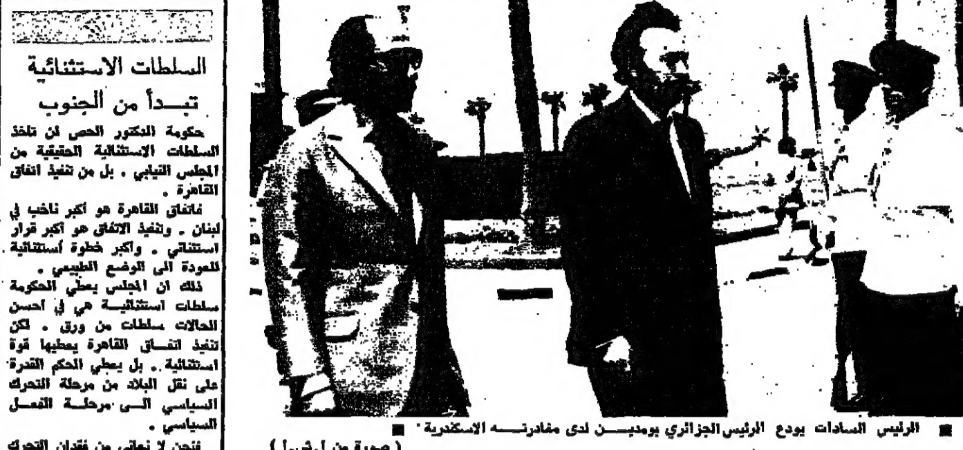
الرئيس السادات يودع الرئيس الجزائري يومئذ لدى مغادرته الإسكندرية

مصدر فلسطيني: السادات طالب بالغاء معسكرات التدريب في ليبيا قال مصدر فلسطيني في القاهرة أمس، إن الرئيس السادات طالب بوقف الجاهزة الليبية لتدريب معسكرات التدريب في ليبيا، وذلك بعد أن أعلن السادات أن هذه المعسكرات تستخدم لتدريب بغارات تخريبية ضد مصر. وأضاف المصدر، إن السادات طالب بالغاء معسكرات التدريب في ليبيا، وذلك بعد أن أعلن السادات أن هذه المعسكرات تستخدم لتدريب بغارات تخريبية ضد مصر. وأضاف المصدر، إن السادات طالب بالغاء معسكرات التدريب في ليبيا، وذلك بعد أن أعلن السادات أن هذه المعسكرات تستخدم لتدريب بغارات تخريبية ضد مصر.